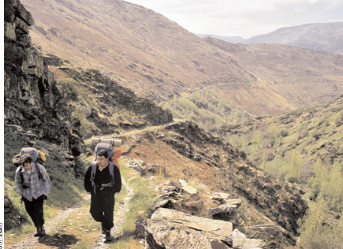
LA MIRADA CIRCULAR PROPONE CONOCER LA COMARCA UNIENDO UNA QUINCENA DE SENDEROS