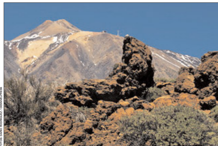
UNO DE LOS LUGARES MÁS RICOS Y DIVERSOS EN LA SUCESIÓN DE PAISAJES VOLCÁNICOS

El pasado mes de julio un grupo de 53 voluntarios de la Federación Navarra de montañismo comenzó a recuperar y marcar el sendero de gran recorrido GR-12. Es la primera acción del plan encaminado a recuperar todos los senderos de gran recorrido navarros que fueron descatalogados por su mal estado.